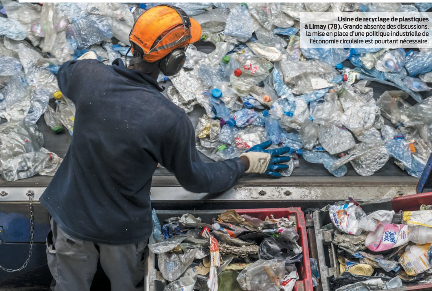
Usine de recyclage de plastiques à Limay (78). Grande absence des discussions, la mise en place d'une politique industrielle de l'économie circulaire est pourtant nécessaire.