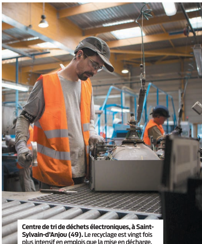
Centre de tri de déchets électroniques, à Saint-Sylvain-d'Anjou (49). Le recyclage est vingt fois plus intensif en emplois que la mise en décharge.